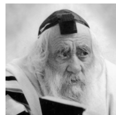
מרן ה"סטייפלער" זצ"ל

רוכזו הדעות (כולל עוד כו"כ מגדולי "ליטא") בנדון בספר הדרת פנים – זקן / בענין גילוח וגידול הזקן – לאור ההלכה / מאת הרב משה ווינער / נדפס בהסכמת גדולי דורנו מכל החוגים / 900 עמודים (בקירוב, במהדורה שלישית)